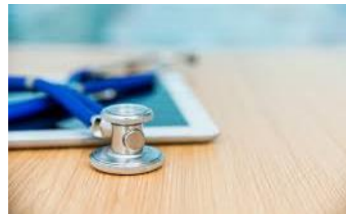
Gezondheid en Zorg