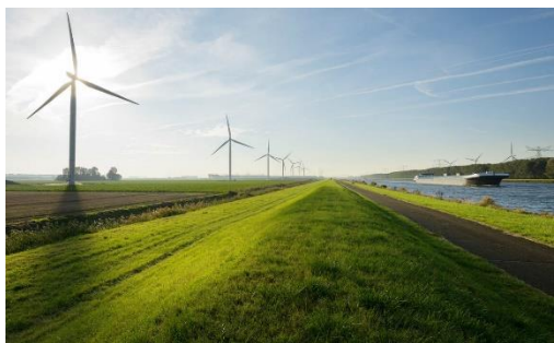
Energie en Duurzaamheid