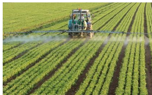
Landbouw, Water, en Voedsel